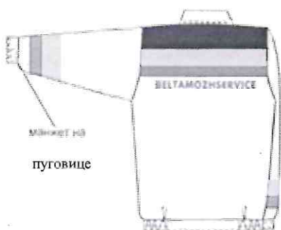
манжет на пуговице